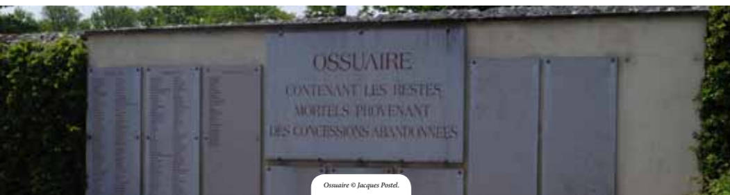
Ossuaire © Jacques Postel.

Dépliant réalisé en collaboration avec la Direction des Espaces verts et la Direction de la Vie Quotidienne, dans le cadre de la publication des Archives communales de Versailles :