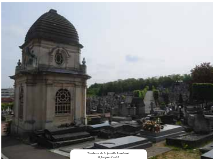
Tombeau de la famille Lambinet

Cimetière des Gonards, 19 rue Porte de Buc, 78000 Versailles