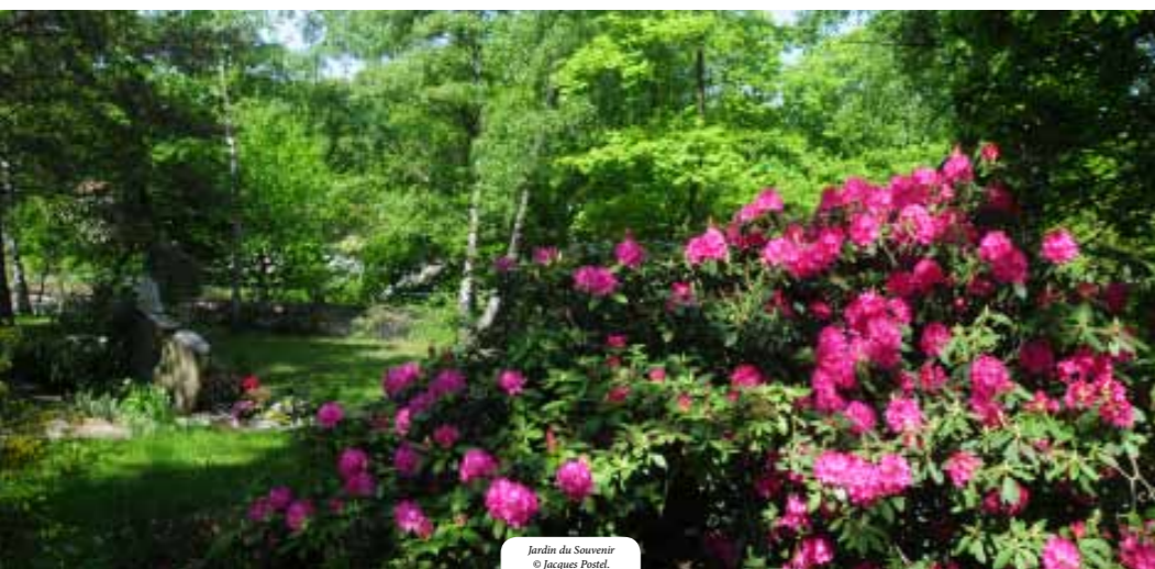
Jardin du Souvenir © Jacques Postel.