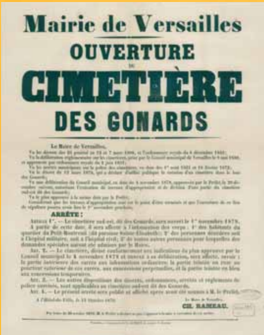
Affiche, 13 octobre 1879. Coll. ACV, 2 M 1465